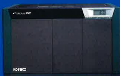
FE インバータシリーズ