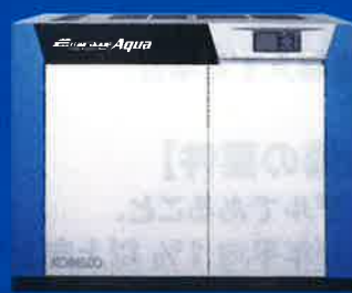
EA インバータシリーズ