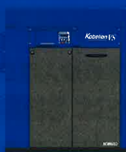
VS II 屋外シリーズ SG II 屋外シリーズ