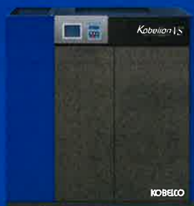
VS II シリーズ SG II シリーズ