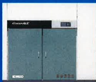
ALE インバータシリーズ