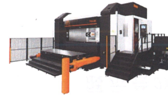
同時5軸制御 横形プロファイラー加工機 VORTEX HORIZONTAL PROFILER 160 XP