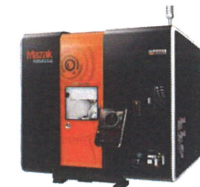
高速・超高精度 同時5軸加工機 UD-400/5X