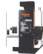
多面加工 立形マシニングセンタ VARIAXIS j series