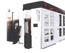
多品種少量生産・同時5軸加工機システム VARIAXIS i-300 AWC