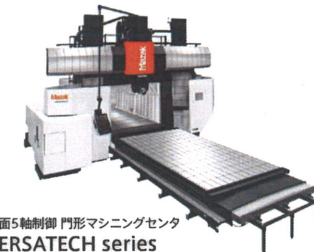
大型多面5軸制御 門形マシニングセンタ VERSATECH series