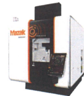
同時5軸制御 立形マシニングセンタ VARIAXIS i series