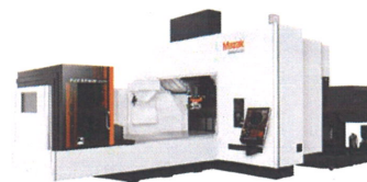
5面加工用 門形マシニングセンタ FJV 5 Face series