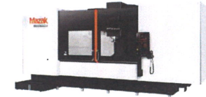
高トルク主軸搭載 立形マシニングセンタ MTV series